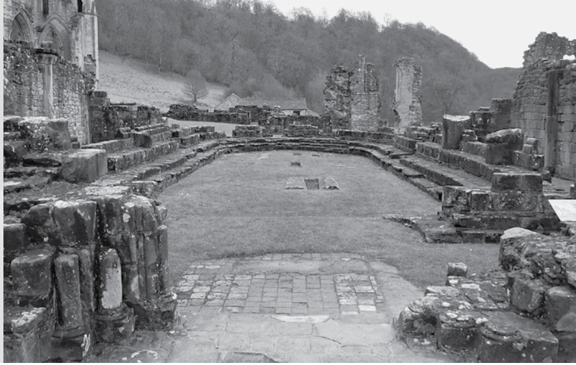
Ruïne van de kapittelzaal van Rievaulx.

bare normen. Meer dan een sobere zaal, waar de koormonniken hun kapittel konden houden, belangrijke gasten ontvangen en novicen aanvaardden, had een abdij niet nodig. Tenzij het een abdij was met een abt die er ongehoorde denkbeelden op na hield.